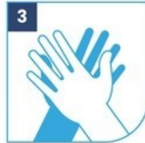
3 Fronta palma contra palma