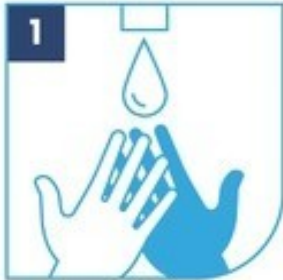
1 Humedece tus manos

El lavado de manos tiene que durar mínimo 20 segundos.