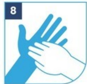
8 Uñas frente a palma