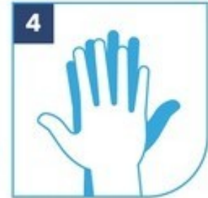
4 Palma sobre dorso