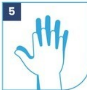
5 Zonas interdigitales