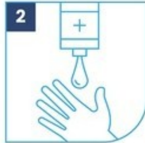
2 Utiliza jabón